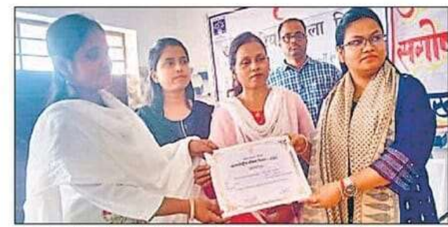
उत्कृष्ट कार्य करने वालीं महिलाओं को सम्मानित करते हुए अधिकारी ।

महिलाओं की भागीदारी सुनश्चित के लिए योजनाएं को किया जाता संचालितः अनुमंडल पदाधिकारी ने बताया कि आप सभी अपने-अपने घरों एवं विभिन्न विभागों में कार्य कर अपने सामाजिक