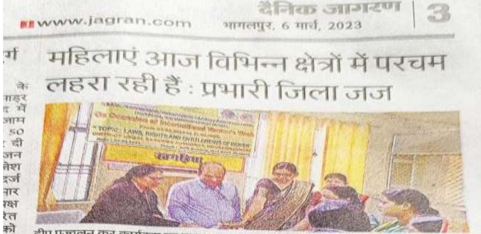
दीप प्रज्वलन कर कार्यक्रम का उदघाटन करते जिला जज 🍩 जागरण

कुछ जींच करवाकर अनका इलाज करेंगे (इनके ध्रय का एक पुनिट करड व्यवस्था करके रशिक्षय पैर कारटने के बाद स्कून पहाया जानेगा। इंडजीत क्यार के द्वारा एक जरूरतमेद तृत्व लाधार व्यक्ति की क्लड डोनेंट किया इसके लिए साव राजद नेता रीशन कुमार और जिलेड बीजारतव ने चन्यवाद दिया और कहा कि हमलोग हमेशा अरूरतमेद लोगी को ब्लड देने के लिए तैयार रहते हैं जब भी हमलीगी की जानकारी होती है कि लोगी की बनड की जरूरत है